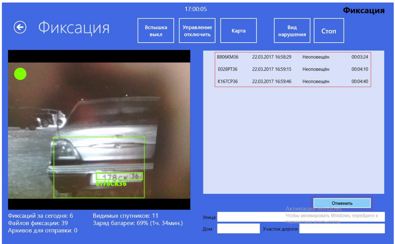
Кнопка «Отменить эвакуацию» и список эвакуаций

Дозор МП сертифицирован как средство измерения времени и координат с фото и видеофиксацией. Это позволяет обеспечить доказательства соблюдения положенного времени эвакуации и оповещение автовладельца.